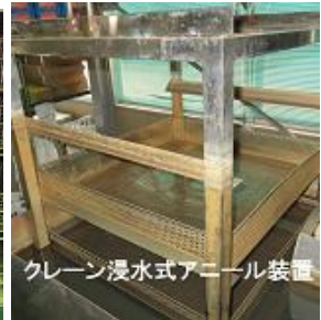
クレーン浸水式アニール装置