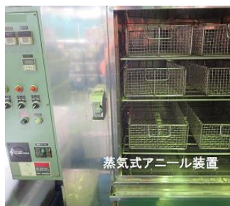
蒸気式アニール装置